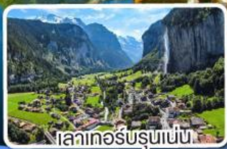
เลาเทอร์บรุนเนน