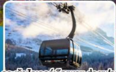
กระเช้า ไอเกอร์เอ็กเพรส สู่อัจฉริยะ