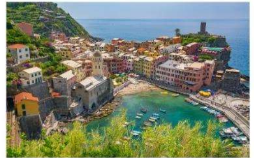
ซิงเคว เทเร

นำคณะเที่ยวชม ซิงเคว เทเร เป็นพื้นที่ที่ UNESCO ประกาศให้เป็นมรดกโลก ด้วยทำเลที่ตั้งของทั้งหมดอยู่บนภูเขาสูง โดมมีหน้าผาสูงชัน และทะเลกว้างใหญ่เป็นฉากหน้า ทำให้มีความสวยงามประดุจดั่งภาพวาด จึงเป็นอุปสรรคสำหรับผู้คนจากภายนอกในการที่จะเข้าไปให้ถึง แต่ในแง่ดีก็คือ หมู่บ้านทั้งห้ายังคงสภาพดั้งเดิมของมันมาได้ตั้งแต่ศตวรรษที่ 11 ประกอบไปด้วย Monterosso al Mare (มอนเตรอสโซ อัล มาเร), Vernazza (เวร์นาซซา), Corniglia (คอร์นีเลีย) , Manarola (มานาโรลา) และ Riomaggiore (ริโอมัจจอร์เร) **ทางบริษัทจะนำทุกท่านเที่ยวอย่างน้อย 1 จากใน 5 หมู่บ้าน**