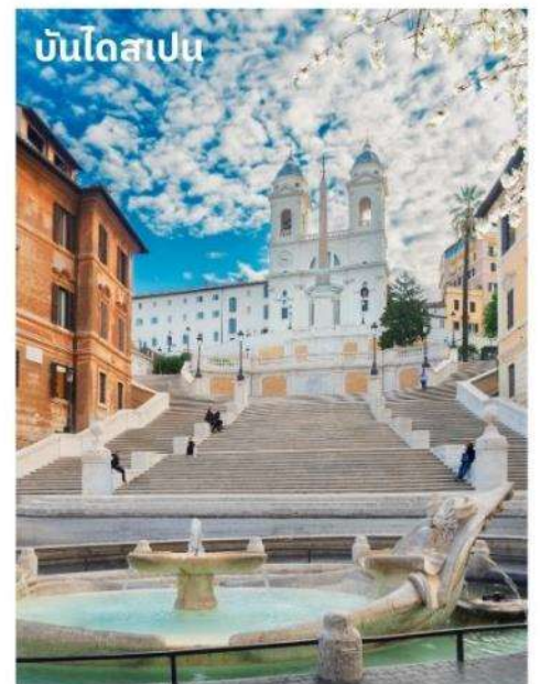
บันไดสเปน