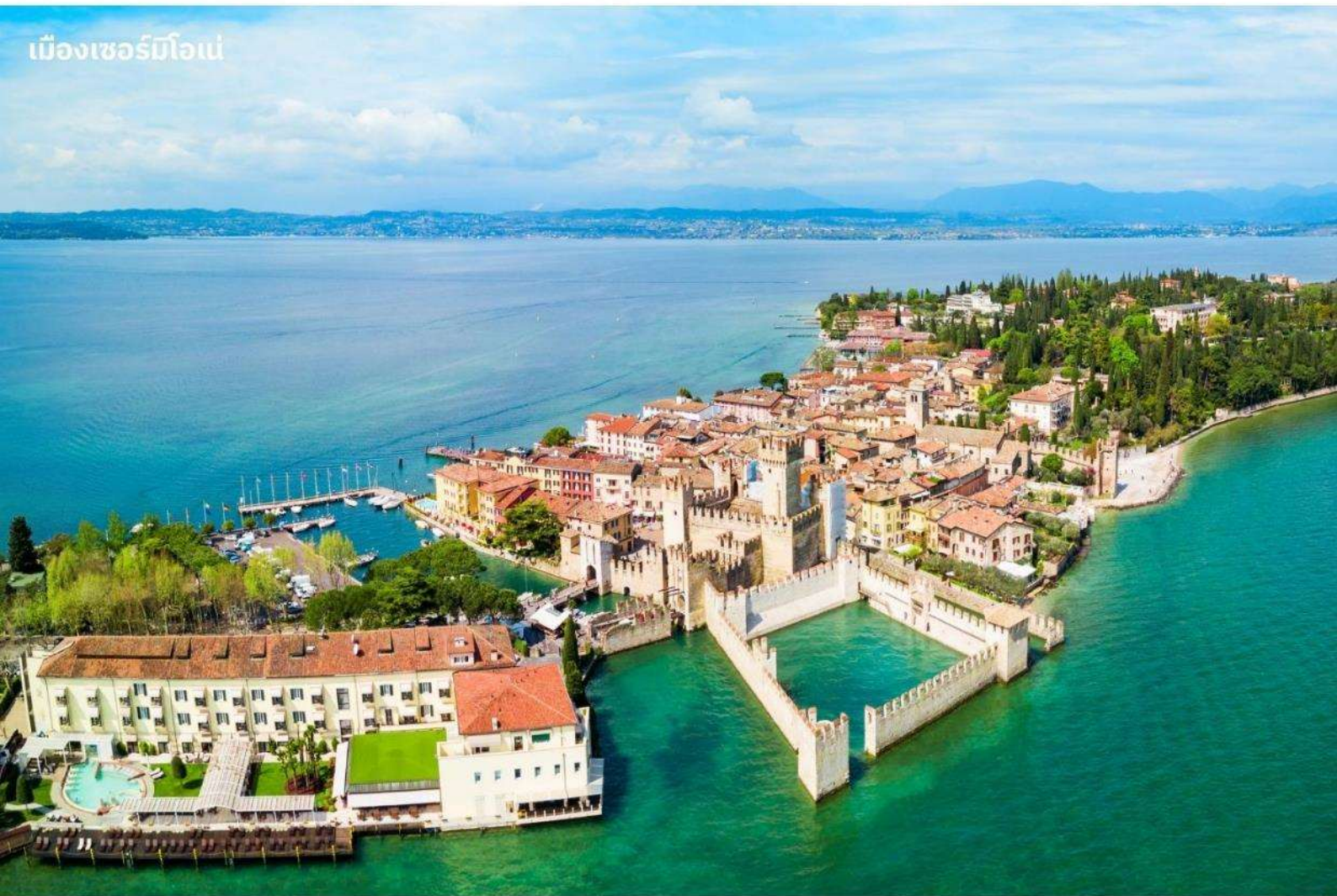
เมืองเซอร์มิโอเน่

บริการอาหารค่ำ ณ ภัตตาคาร นำท่านเข้าสู่ที่พัก IH Hotels Milano Lorenteggio หรือเทียบเท่า