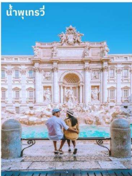
น้ำพุเทรวี่

จากนั้นอิสระตามอัธยาศัยกับการเลือกซื้อสินค้าแฟชั่นและของที่ระลึกในบริเวณย่าน บันไดสเปน (The Spanish Step) ซึ่งเป็นแหล่งแฟชั่นชั้นนำสุดหรูและยังเป็นแหล่งนัดพบของชาวอิตาเลียน