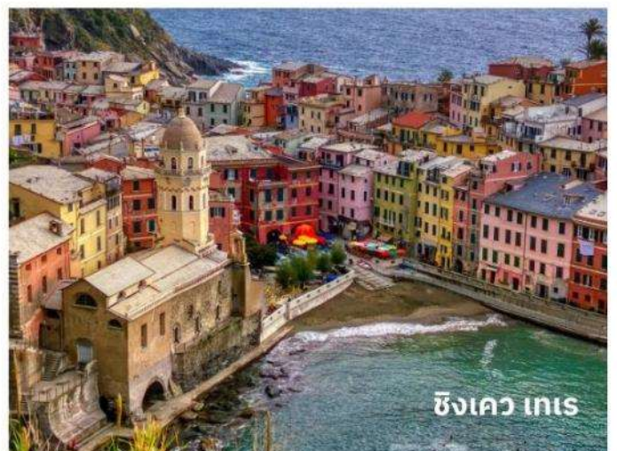
ซิงเคว เทเร

ท่านสามารถทำการสแกน QR CODE นี้ เพื่อรับชม “ซิงเควเทเร” ในรูปแบบวิดีโอ