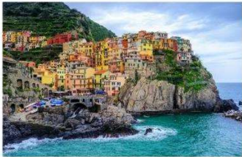
ซิงเคว เทเร

จากนั้นนำท่านเดินทางต่อด้วยรถไฟ สู่หมู่บ้านมรดกโลกและอุทยานแห่งชาติ ซิงเคว เทเร Cinque Terre อ่านว่า ซิงเควเทเร หรือแปลในความหมายตามภาษาอังกฤษก็คือ The Five Land แดนมหัศจรรย์ทั้ง 5 ที่ประกอบกันขึ้นมาเป็นดินแดนแห่งความงดงาม หมู่บ้านเล็กๆ 5 หมู่บ้านที่ซ่อนตัวอยู่ห่างไกลจากสายตาของคนภายนอก แผ่นดินที่ยากจะเข้าถึงได้โดยง่าย หมู่บ้านเล็กๆ 5 หมู่บ้านที่ตั้งเรียงอยู่มีห่างกัน