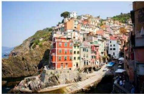
ซิงเคว เทเร