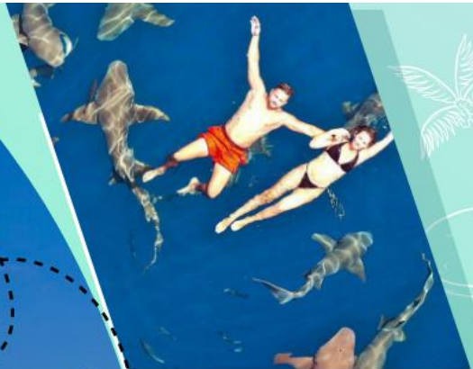
SHARK BAY TRIP