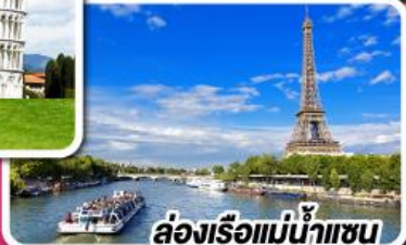
ล่องเรือแม่น้ำแซน