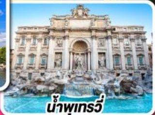
น้ำพุกรวี

04-13 ส.ค. 67 27 ส.ค. 67-05 ม.ค. 68 (ปีใหม่) 28 ส.ค. 67-06 ม.ค. 68 (ปีใหม่) 28 ม.ค.-06 ก.พ. 68