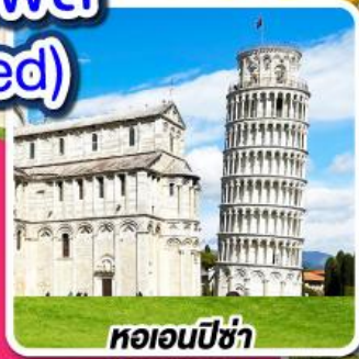
หอนอนปิซ่า