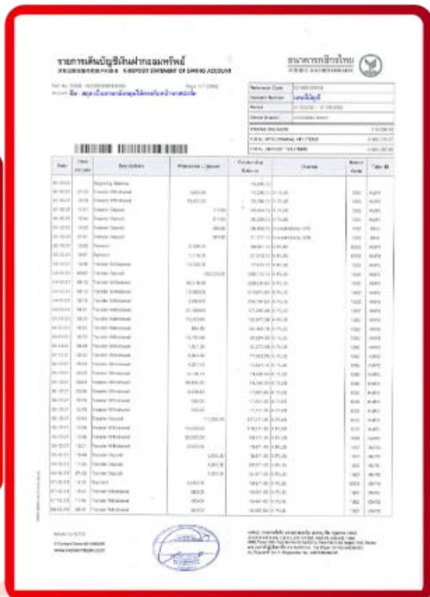
ตัวอย่าง Bank Statement ที่ผู้สมัครต้องขอธนาคาร

3.4 ปรับสมุดบัญชีธนาคารตัวจริง และเตรียมไปในวันที่ยื่นวีซ่า