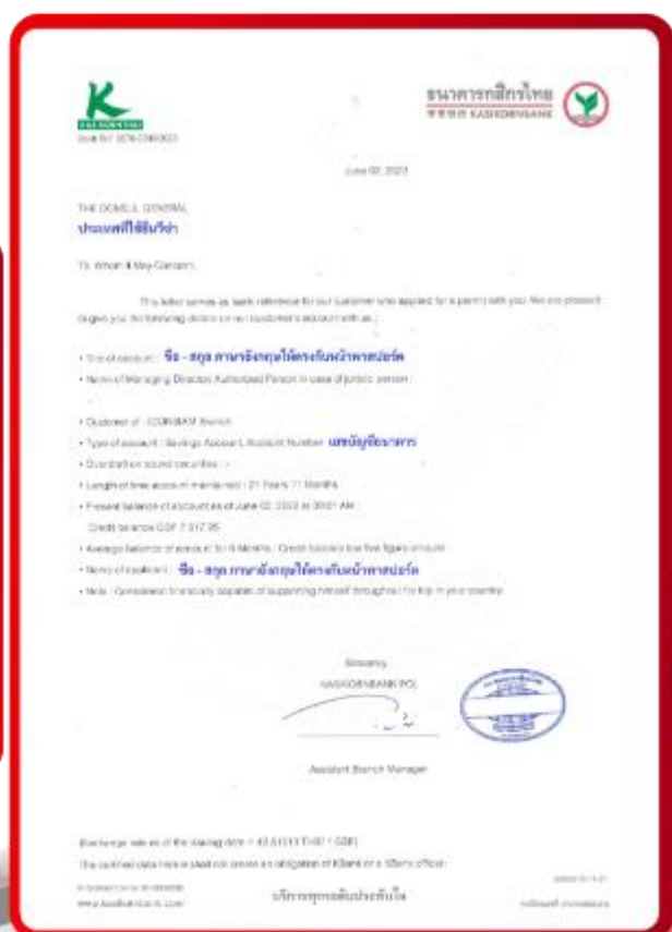
ตัวอย่าง Bank Guarantee ที่ผู้สมัครต้องขอธนาคาร