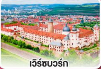
เว็ร์ซบวร์ค