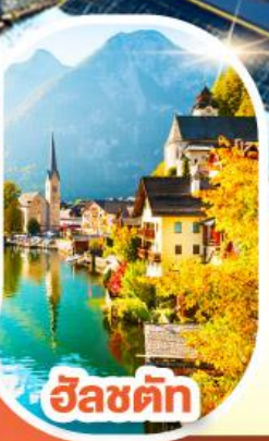
อินส์บรอก

เดินทาง EVA AIR A STAR ALLIANCE MEMBER 17- 24 มี.ค. 68 / 07-14, 10-17 เม.ย. 68 01- 08 พ.ค. 68 / 29 พ.ค.- 05 มิ.ย. 68 16- 23 มิ.ย. 68