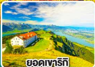
ยอดเขารีก์