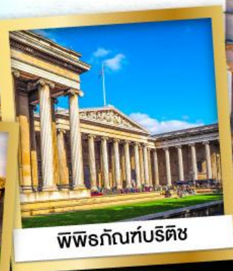
พิพิธภัณฑ์บริติช