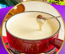
ฟองดูซีส