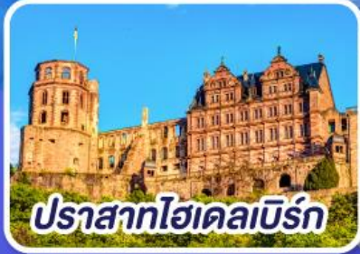
ปราสาทไฮเดลเบิร์ก