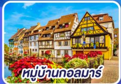
หมู่บ้านกอลมาร์