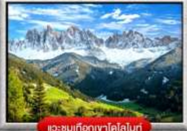
แะชมเทือกเขาโดโลไมท์