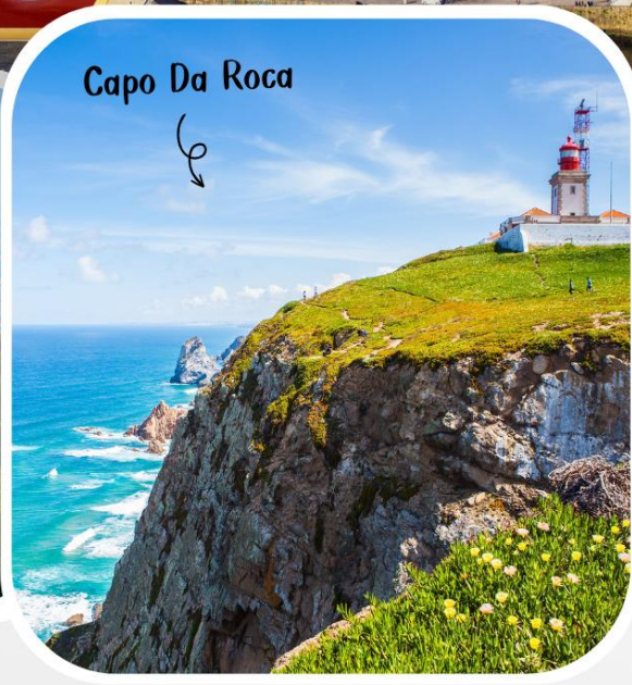
Capo Da Roca