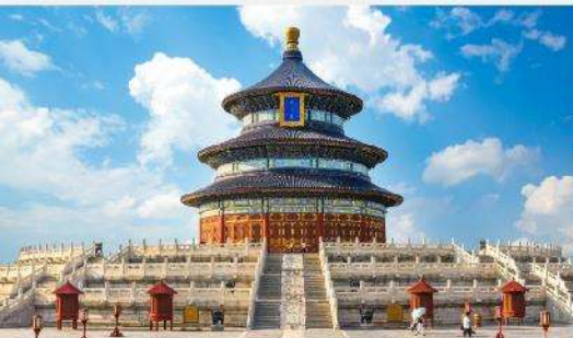
หอบูชาฟ้าเทียนถาน