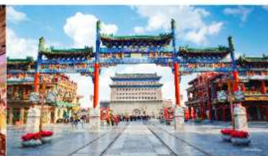
ถนนโบราณเฉียนเหมิน