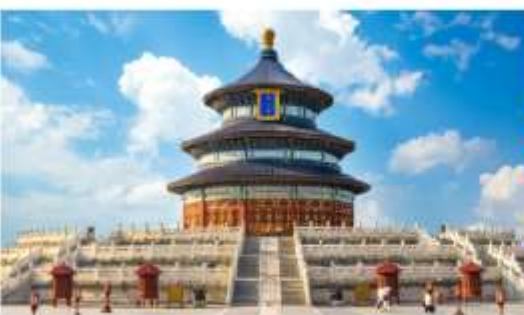
หอบูชาฟ้าเทียนถาน