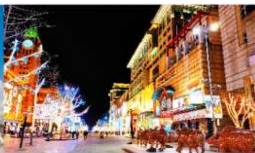
ถนนหวังฝูจิ่ง