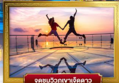
จุดชมวิวกูเขาเจ็ดดาว