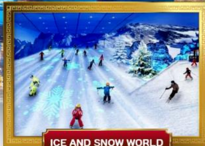
ICE AND SNOW WORLD