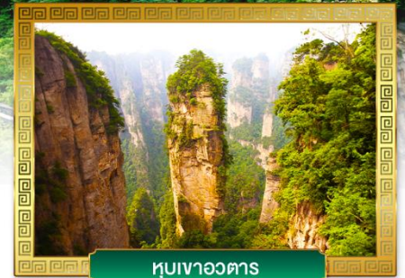
หุบเขาหวอดาร