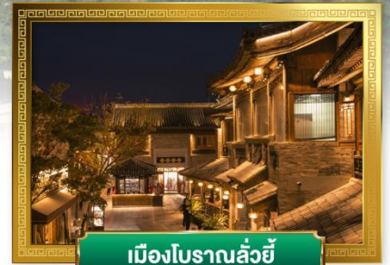
เมืองโบราณลั่วอี้