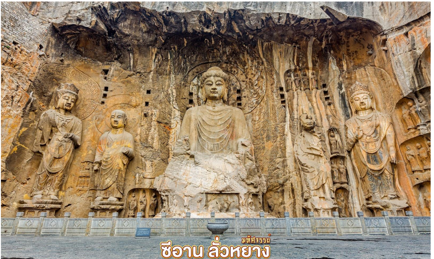
มัทศจรรย์ ซีอาน ลั่วหยาง

กลางวัน ๑๐ บริการอาหารกลางวัน ณ ภัตตาคาร