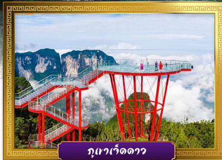
ภูเขาเว็ดดาว

✓ เดินเล่นถนนคนเดินหวงซิงลู่และซีปู้เจีย