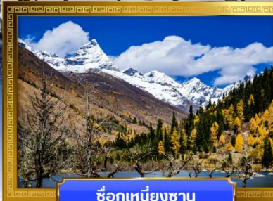
ชื่อภูเขาหิมะ