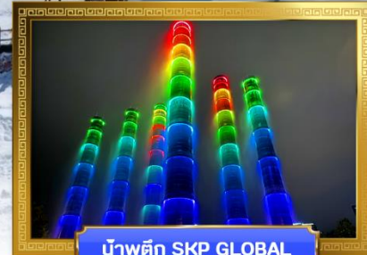
น้ำพุตึก SKP GLOBAL