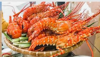
Nha Trang Night Market