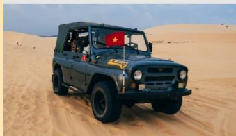
ทะเลทรายขาว