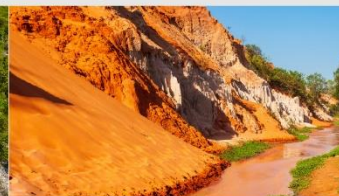
ลำธารนางฟ้า

*ทางบริษัทฯ ขอสงวนสิทธิ์ในการสลับโปรแกรมทัวร์ตามความเหมาะสมขึ้นอยู่กับสถานการณ์หน้างาน โดยคำนึงถึงผลประโยชน์ของลูกค้าเป็นสำคัญ