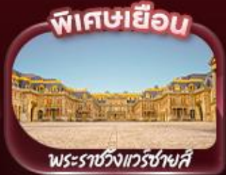
พิเศษเยือน