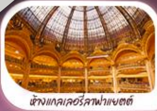
ห้างแกลเลอรีลูฟวร์