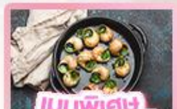
เมนูพิเศษ หอยออสตาโก้

เยอรมัน เนเธอร์แลนด์ เบลเยียม ฝรั่งเศส Keukenhof