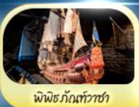
พิพิธภัณฑ์ทิวาชา