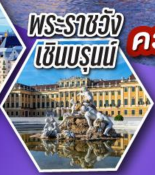
พระราชวัง เซินบรุนน์