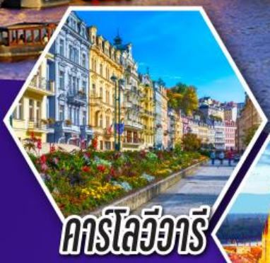
คาร์ลสวือร์