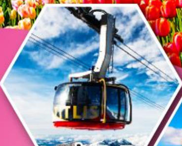
กระเช้าที่ตลีส