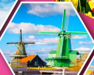
หมู่บ้านกังหันลม ชาสคินส์