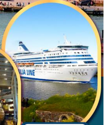
เรือสำราญ TALLINK SILJA LINE