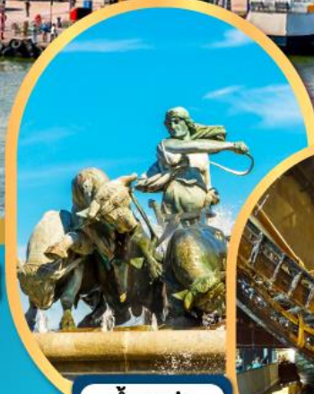
น้ำพุแห่งราชินีเกฟ็อน