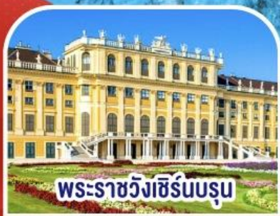
พระราชวังซีร์นบรุน