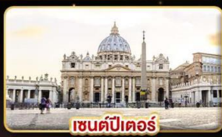
เซนต์ปีเตอร์