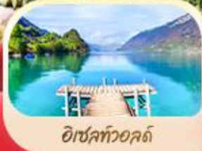
อีเซลท์วอลด์