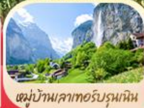
หมู่บ้านเลาเทอร์บรุนเนิน