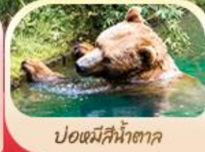
ป้อมมีสีน้ำตาล