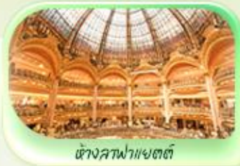
ห้างลาฟาแยตต์