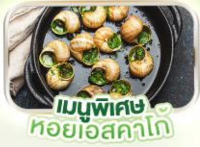
เมนูพิเศษ หอยเอสคาโด

พิเศษ ล่องเรือแม่น้ำแซนชมเมือง โดย บาโต มูช