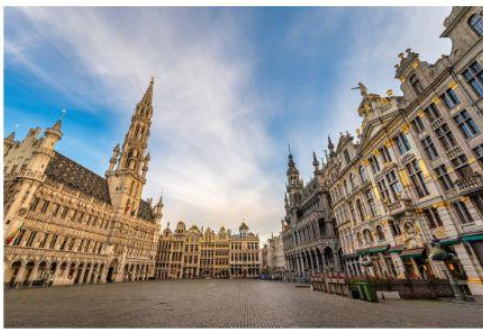
รูปปั้นแมนเนเก่นพิส