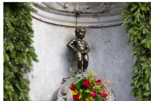
รูปปั้นแมนเนเก่นพิส