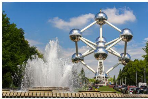
อะตอมเบียม