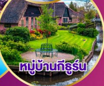
หมู่บ้านกังธูร์น