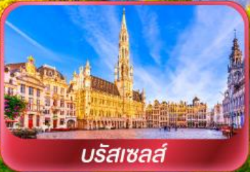
บรัสเซลส์