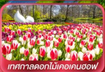
เทศกาลดอกไม้เคอเคนฮอฟ