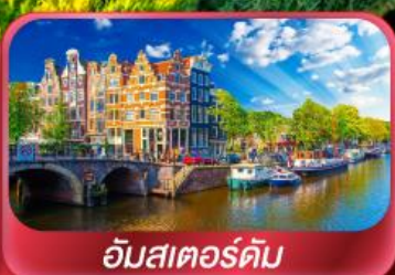
อัมสเตอร์ดัม

ไปดูกังหันลมหมุนวนที่หมู่บ้านซานสคินส์กัน