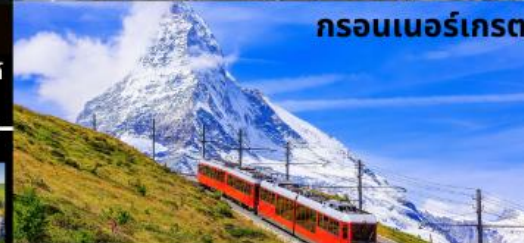
กรอนเนอร์เกรต