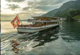
ล่องเรือชมวิวกะเสาสลูเซิร์น