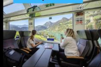
รถไฟ Panorama วิวดูวิว