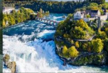
เขื่อนน้ำตกโรน