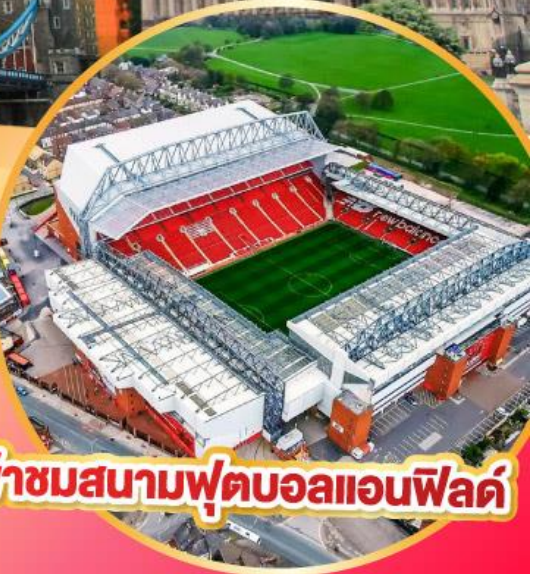
เข้าชมสนามฟุตบอลแอนฟิลด์

เมนูสุดพิเศษ!! Fish & Chips อาหารไทย และ กัดตาคาร์ดิง Four Season