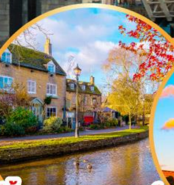
เบอร์ตันออนเดอะวอเตอร์