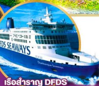
เรือสำราญ DFDS