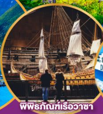
พิพิธภัณฑ์เรือวาซา