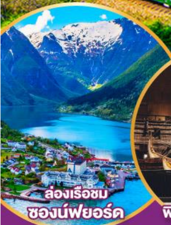
ล่องเรือชม ช่องน้ำพยอร์ด