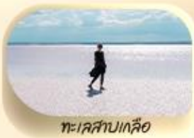
ทะเลสาบเกลือ