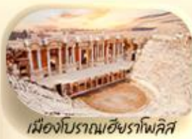
เมืองโบราณเฮียราโพลิส